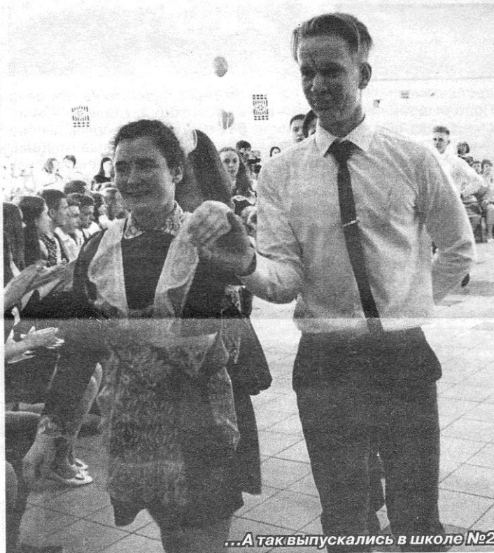
...А так выпускались в школе №2