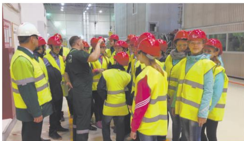
В начале 2015 года с экскурсией на ЦБК побывали ученики школы №5 (7б класс). Ребята не просто проехали в автобусе по территории комбината, но и посетили несколько цехов, где им рассказали о том, как организован производственный процесс. Судя по отзывам, экскурсия школьникам понравилась.