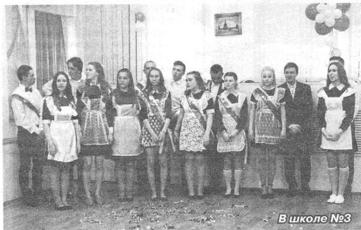
В школе №3