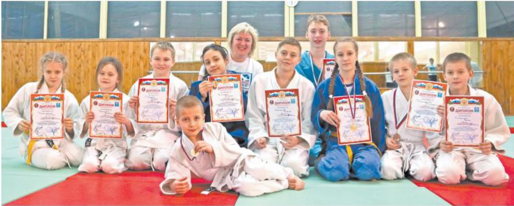
Шесть золотых и четыре бронзовые медали – отличный результат!